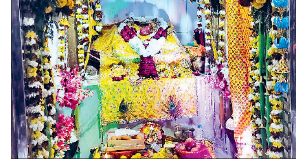
रेवाड़ी। वृंदावन चौक स्थित मंदिर में सजी भगवान श्रीजगन्नाथ की प्रतिमा।