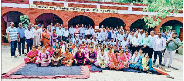
रेवाड़ी। कार्यशाला के समापन पर मौजूद प्राइमरी शिक्षक।