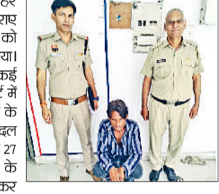
रेवाड़ी। गोवंश मामले में गिरफ्तार हुए आरोपी को कसौला पुलिस ने गिरफ्तार कर लिया।