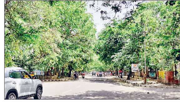
सड़कों के किनारे लगेगी सड़क के समानांतर बिजली की लाइनें गुजर रही हैं। इन लाइनों से पेड़ों की टहनियां सटी हुई हैं। ऐसे ही हालात गांवों के आम रास्तों से गुजरने वाली बिजली की लाइनों के बने हुए हैं। कई जगह पर तो लाइनों के समीप पेड़ों के बीच से गुजर रहे हैं। बरसात के समय पेड़ गीला होने की वजह से पेड़ों का कारण खाति हो सकते हैं। शहर में जितने भी बिना नंबर के पेड़ हैं, वह सब नगर परिषद के अधीन आते हैं। इनका कटाई-छंटाई का कार्य नगर परिषद को करना होता है। नगर परिषद को ट्रिमिंग मशीन मिलने के बाद भी पेड़ों की कटाई-छंटाई नहीं की जा रही है। ट्रिमिंग मशीन कार्यालय खड़ी-खड़ी शोपीस बनी हुई है।