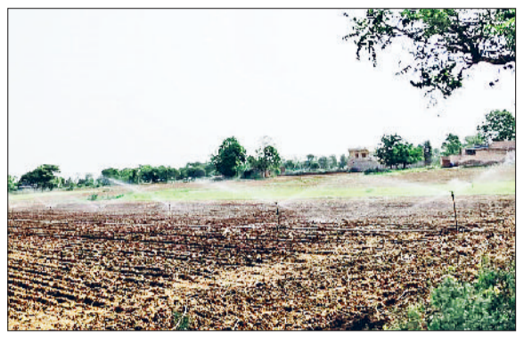
रेवाड़ी। एक खेत में फव्वारों से सिंचाई करते किसान व रविवार शाम को छाए बरसात के बादल व नेहरू पार्क में बैठे लोग।