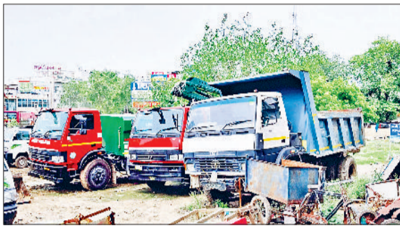
रेवाड़ी। नगर परिषद सफाई शाखा में खड़ी ट्रिमिंग व एंटी स्मॉग मशीन, नगर परिषद सफाई शाखा में मशीनों के पास पड़ा कबाड़, सचिवालय रोड पर लटकती पेड़ों की टहनियां।

नगर परिषद की ओर से शहर के पेड़ों की कटाई-छंटाई के लिए स्काई लिफ्ट ट्री मटेनेंस मशीन यानि ट्रिमिंग मशीन तथा प्रदूषण को नियंत्रित करने के लिए वाटर स्पिंकलर मशीन यानि एंटी स्मॉग मशीन खरीदी जा चुकी है। दोनों मशीनों को खरीदे हुए 4 महीने से ज्यादा समय बीत चुका है, लेकिन इन मशीनों का आज तक यूज नहीं किया गया है और न ही अभी तक मशीनों की आरसी भी तैयार हो पाई है, जबकि नगर परिषद चेरपरसिन की ओर से पिछले दिनों दोनों मशीनों को कार्य के लिए इरी झंडी दिखाई जा चुकी है। इससे पहले भी नगर परिषद के डंपर बिना आरसी के कंडम हो चुके हैं। नप अधिकारियों की ओर से दोनों मशीनों को बार्-बार् जगह बदल कर खड़ा किया जा रहा है। पहले ये मशीनें नगर परिषद कार्यालय में