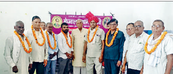
रेवाड़ी। ब्लॉक कार्यकारिणी का स्वागत करते समाज के लोग।