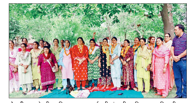
रेवाड़ी। बहुउद्देश्यीय महिला स्वास्थ्य कर्मचारी संघ की नवनियुक्त पदाधिकारी।